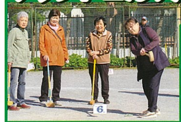
11月10日(日) 52名参加 ろう学校