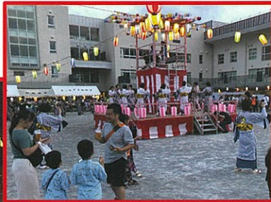
7月27日(土)~28日(日) 大谷戸小学校