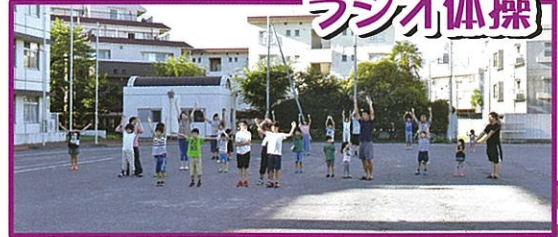
7月20日(土)~26日(金) ろう学校