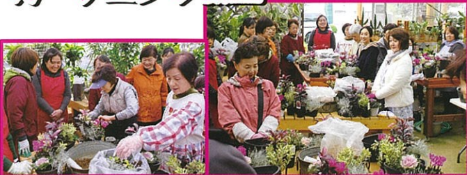
11月20日(水) 50名参加 中原園芸