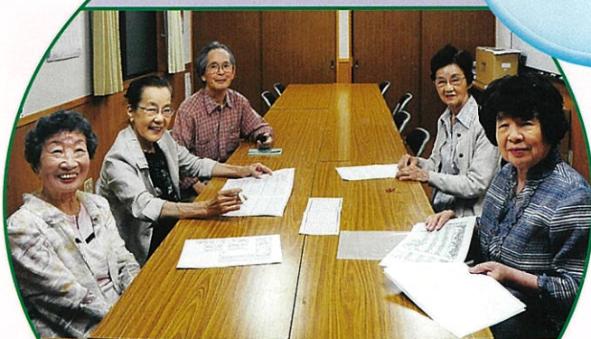
高齢化社会 にな を担う新リーダー 新役員の皆さん、すてきな笑顔が揃いました。楽しい会になりますように! (5月14日)