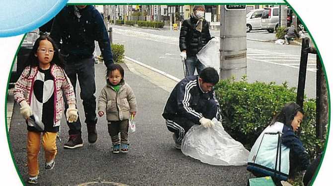
こども達もお手伝い さわやかな朝、かわいい小さな手でお手伝い。ありがとう! (3月15日)