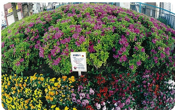
昨年11月に植えた色とりどりのパンジーと、鮮やかなピンクのツツジが咲き誇り、街が華やかになりました。 (4月~5月)