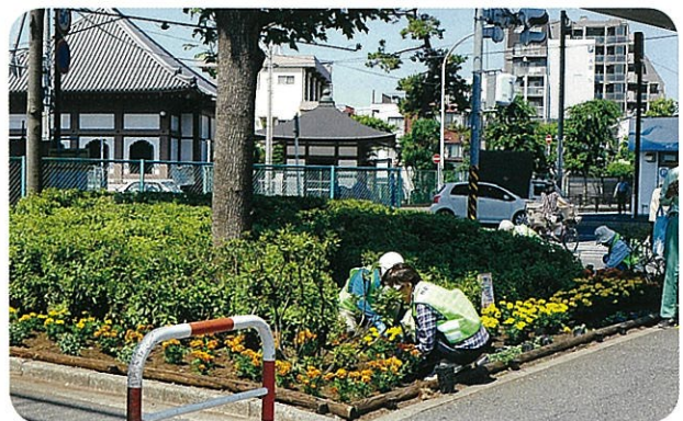
5月下旬、黄金色のマリーゴールド・めずらしい花オレガノ(花鑑賞のハーブ種)に植え替え。真夏の陽射しに負けない、あざやかな花壇になりますように! (6月1日)