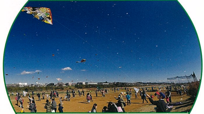
青空を彩るカラフルなたこ 日本の伝統的な遊び、澄み切った青空に飛び交うたこ。変化の時代の気流に乗り、天高く跳びあがりましょう。 (1月11日 多摩川河川敷)