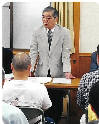
末に完成(4面写真)。他町会に比べ、大人神輿を有する当町会は小屋が