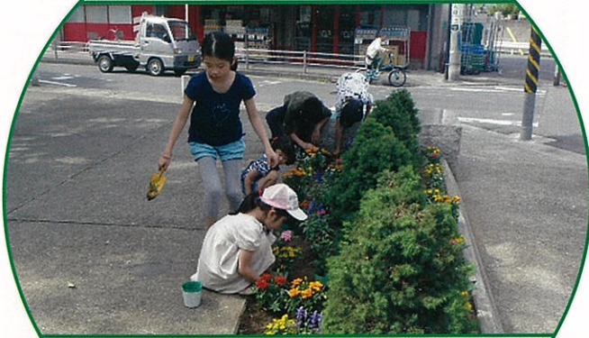
公開空地をはなやかに こども達の豊かな感性で、マンション周囲に季節の花が咲きました。夏に向けてカラフルに彩る花壇を楽しみに! (5月23日)