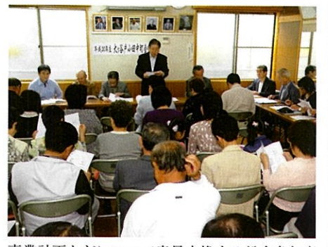
事業計画などについて意見交換する総会参加者

【承認された主な事項】 ◎おがやと納涼盆踊り大会 5町会合同のおがやと納涼盆踊り大会が7月下旬、大涼盆踊り大会が、5月18日午前11時から町会館で開催されました。