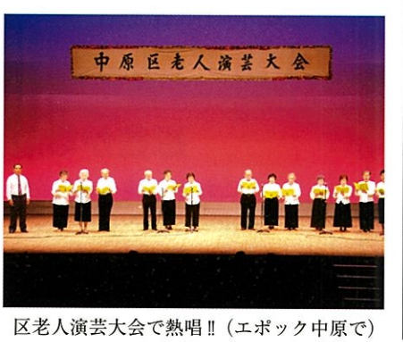
区老人演芸大会で熱唱!! (エボック中原で)

方々に背中を押して頂き大任を引き受けたものの不安の気持ちを一杯でした。年月と共に視野も広がり、貴重な体験を積み重ねることができました。大勢の皆さまのご協力を得て、21年間務めさせて頂き、心より厚く感謝しています。