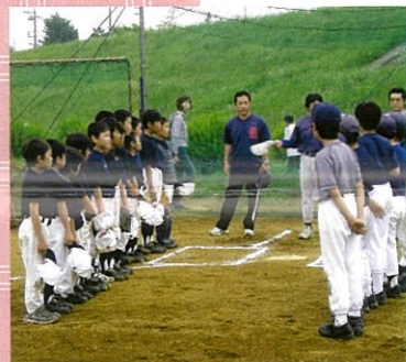
多摩川での練習試合

子どもは、地域によって育てられるから社会人になるのであって、今の子どもが冷たくて自分勝手なのは、地域の大人たちが他人の子に無関心だからなのです。