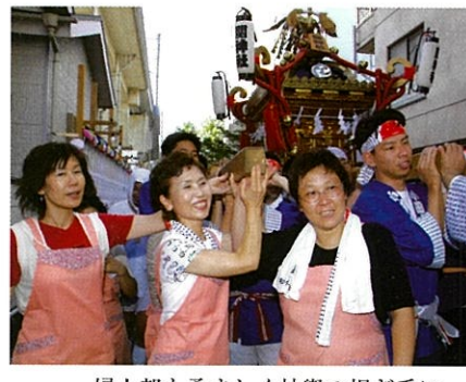
婦人部も勇ましく神輿の担ぎ手に

また、最近全国的に若年層の犯罪が増加しています。町会でも、11名の方が地域ボランティアとして、今年度から小学校などを対象に「あいさつ運動」を展開しています。 なお、町内会の行事など、会員の皆さまに周知徹底を図るため、会報・会館案内板・掲示板などを充実していきます。 最後に、防災・防犯・環境問題など私たちが取り巻く課題が山積しています。「安心・安全」の住みよい街にするには、近隣同士の協力が必要です。みんなで郷土愛を育て、安全で快適な生活環境を築いていきましょう。