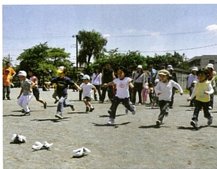
幼児による宝さがし

しかし、奇跡的にも朝から晴天に恵まれ、6月1日、大谷戸小学校校庭で志村町会長はじめ町会役員、荒井校長先生、グランアルトの子ども達を含め総勢250余名で実施する