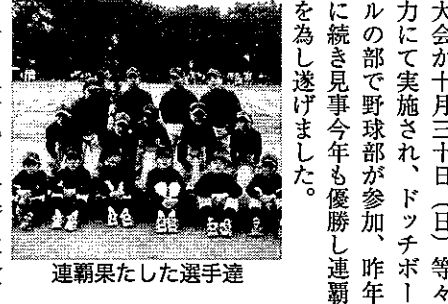
連覇果たした選手達

小田中連覇 中原区民総ぐるみスポーツ 大会が十月三十日(日)等々 力にて実施され、ドッチボー ルの部で野球部が参加、昨年 に続き見事今年も優勝し連覇 を為し遂げました。