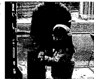
お父さんと一緒に

町会行事の参加 役員と努力又、天候にも恵ま れた結果昨年より売上げも良 く収益金については活動費に