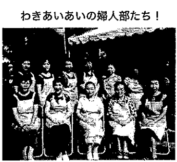
わきあいあいの婦人部たち！

反省会には大勢の方に出席し ていただき、ふれ合いの輪が 広がりました。 これからも、町内会の「底力」 として頑張っていきたいと思 います。