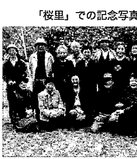
「桜里」での記念写真